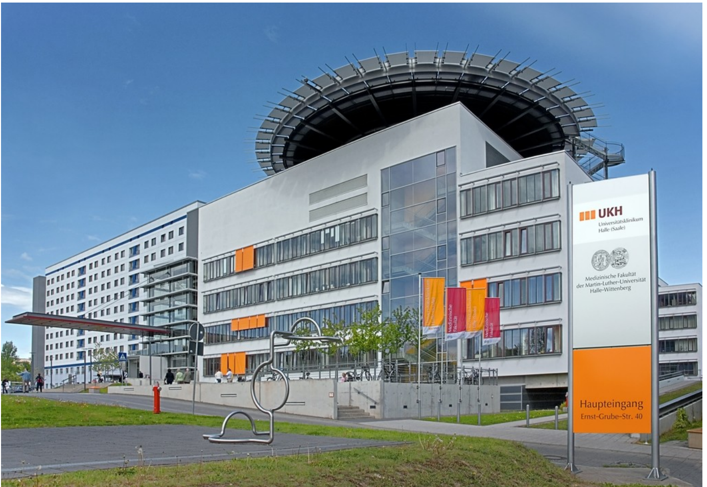
Abbildung: Haupteingang Universitätsklinikum Halle (Saale)

Im Universitätsklinikum Halle (Saale) sind die modernen medizinischen Krankenversorgungseinrichtungen einer traditionsreichen Universität vereint. In fachlich breit gefächerten Kliniken und Instituten stellt das Universitätsklinikum als der Maximalversorger im südlichen Sachsen-Anhalt die medizinische Betreuung der Patienten auf höchstem Niveau sicher.